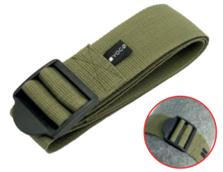
K6 11176 / K10 11176